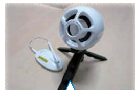
対話支援機「コミュニケーション」