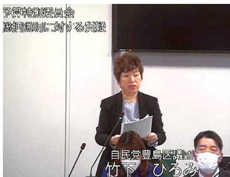
▲予算特別委員会で会派を代表し総括質問に立つ

区議会第1回定例会で、令和6年度豊島区予算が決まりました。一般会計の総額は1,529億円で、学校改築の推進など投資的経費の増加等によって過去最大規模の予算となりました。